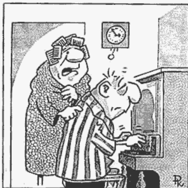
- Václave probud' se, hraješ na piano -

Podle uvedených zásad tříprstých varhaníků následuje harmonizace České národní hymny - Wo ist mein Heim, mein Vaterland?